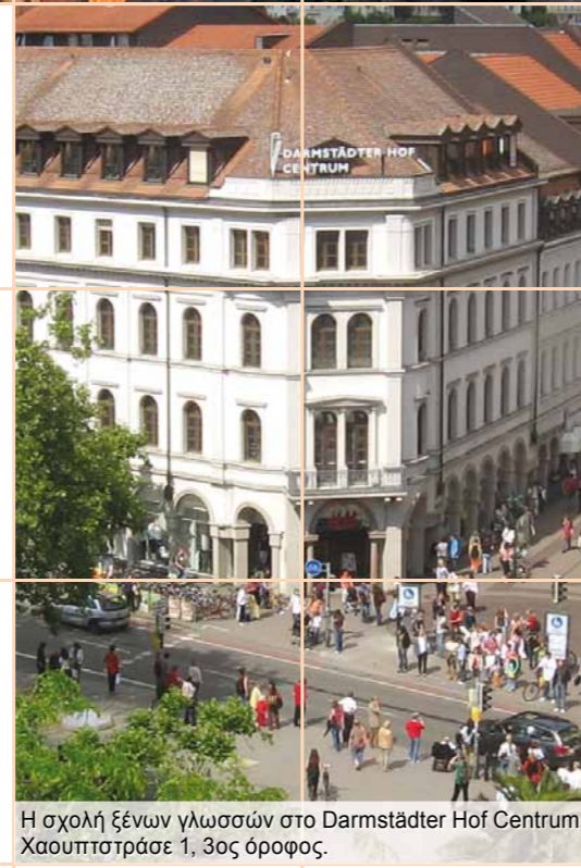
Η σχολή ξένων γλωσσών στο Darmstädter Hof Centrum, Χαουππστράσε 1, 3ος όροφος.

Μαθήματα ξένης γλώσσας στη Χαϊδεμβέργη αραβικά, βουλγαρικά, βραζιλιάνικα, κινέζικα, γερμανικά, αγγλικά, γαλλικά, ελληνικά, ιταλικά, γιαπωνέζικα, κροατικά, ολλανδέζικα, πολωνέζικα, πορτογαλικά, ρουμανικά, ρωσικά, σουηδικά, ισπανικά, τσέχικα, τούρκικα, ουγγαρέζικα κ.α. Διεθνές εξεταστικό κέντρο TestDaF, TELC, TOEFL, TOEIC, LCCL, onDaF, TestAS κ.α. Επαγγελματική σχολή για ξένες γλώσσες αναγνωρισμένη από το κράτος αλληλογράφος ξένων γλωσσών, ευρωγραμματέας, αλληλογράφος για παγκόσμιο εμπόριο, μεταφράστρια/μεταφραστής. Ταξίδια που σχετίζονται με την εκμάθηση ξένων γλωσσών Αγγλία, Ιρλανδία, Μάλτα, Η.Π.Α., Καναδάς, Αυστραλία, Γαλλία, Ιταλία, Ισπανία, Πορτογαλία, Κεντρική και Λατινική Αμερική, Ρωσία, Ιαπωνία, Κίνα κ.α. Διεθνής επαγγελματική ακαδημία σπουδές που αποτελούνται από δύο μέρη Ιδιωτική σχολή Χαϊδεμβέργης γυμνάσιο, σχολείο μέσης εκπαίδευσης που τελειώνει με τη 10η τάξη, επαγγελματικό κολέγιο. Επαγγελματικές σχολές παιδαγωγός στον τομέα επαγγελματική αποκατάσταση και θεραπεία, παιδαγωγός ανηλίκων, παιδαγωγός ανηλίκων που βρίσκονται σε ίδρυμα. Ανώτατη σχολή για οικονομία, τεχνολογία και πολιτισμό Μετεκπαιδευτικό κέντρο οικονομίας επιχειρήσεων ειδικός/ειδική υπάλληλος εμπορίου, οικονομολόγος επιχειρήσεων Ακαδημία24 μετεκπαίδευση παράλληλα με την εργασία